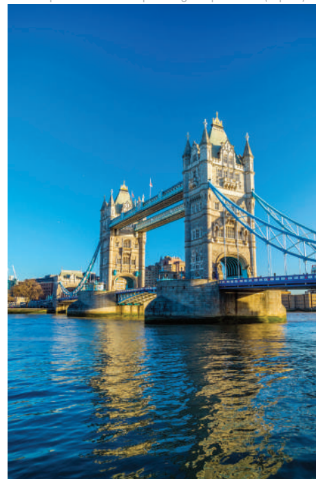
Tower Bridge - Croisière sur la Tamise

Voyage en Eurostar depuis Paris : Nous organisons moyennant un supplément, un accueil la veille du départ et au retour depuis les gares parisiennes (cf p.15)