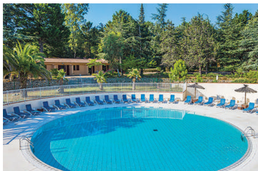
La piscine du village Vacances

Sur tous nos séjours : activités de loisirs, veillées, soirées à thèmes organisées par notre équipe d'animation sur place.