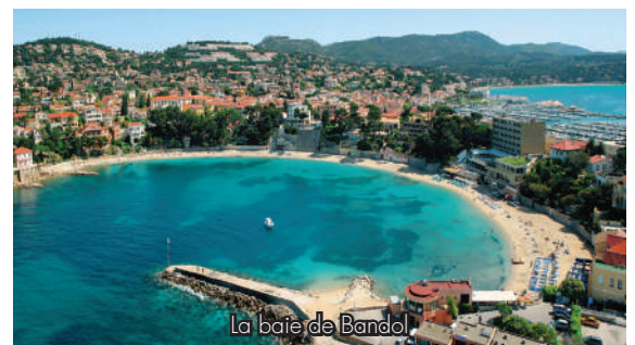
La baie de Bandol