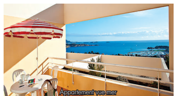
Appartement vue mer

Sur tous nos séjours : activités de loisirs, veillées, soirées à thèmes organisées par notre équipe d'animation sur place.