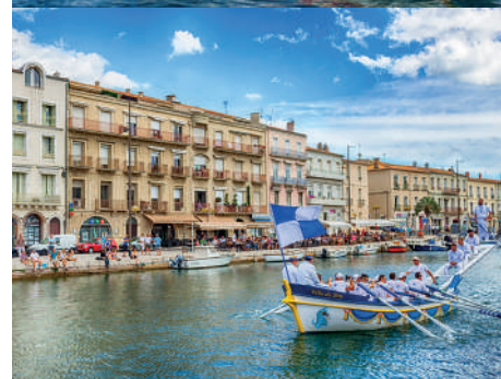
Les joutes nautiques à Sète