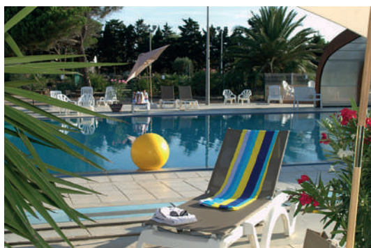
Votre club vacances

Sur tous nos séjours : activités de loisirs, veillées, soirées à thèmes organisées par notre équipe d'animation sur place.