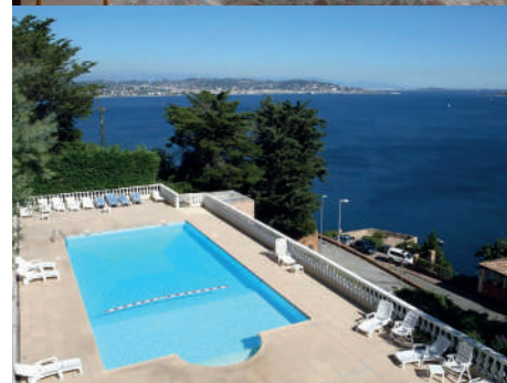
Votre résidence vue mer