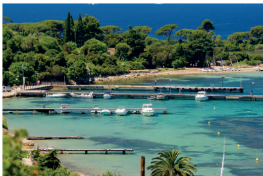
Croisière en bateau : Les îles de Lérins

Sur tous nos séjours : activités de loisirs, veillées, soirées à thèmes organisées par notre équipe d'animation sur place.