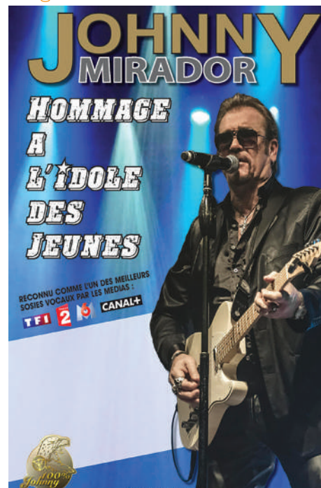
Show en live du sosie de Johnny

Escalé et Réorientation : Macon ou Bollène