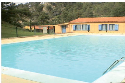
La piscine du village vacances

Sur tous nos séjours : activités de loisirs, veillées, soirées à thèmes organisées par notre équipe d'animation sur place.