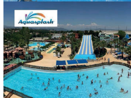
Marineland et Aquasplash