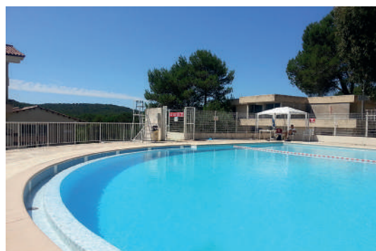
La piscine de la résidence

Sur tous nos séjours : activités de loisirs, veillées, soirées à thèmes organisées par notre équipe d'animation sur place.