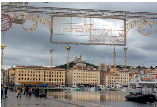
Marché de Noël du Vieux Port à Marseille