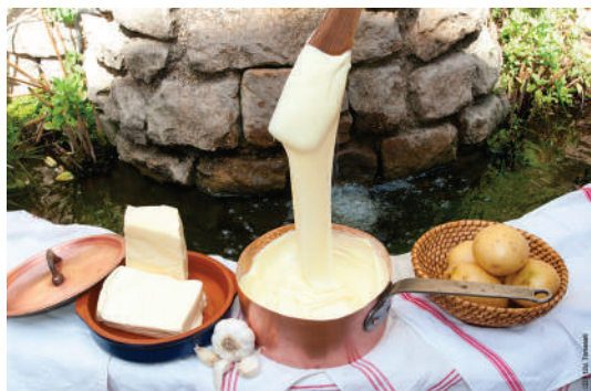
Dégustation du fameux Aligot

Sur tous nos séjours : activités de loisirs, veillées, soirées à thèmes organisées par notre équipe d'animation sur place.