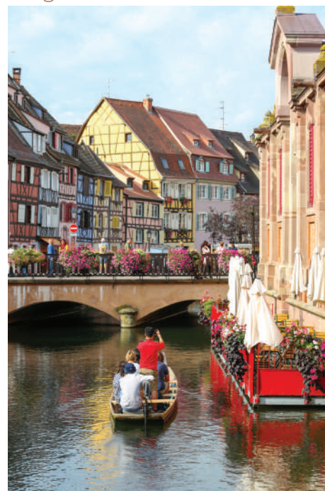
Colmar : La petite Venise

Escale et Réorientation : Macon ou Orléans