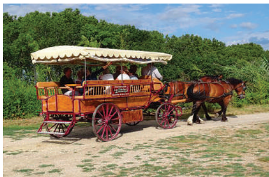
Balade en calèche

Sur tous nos séjours : activités de loisirs, veillées, soirées à thèmes organisées par notre équipe d'animation sur place.