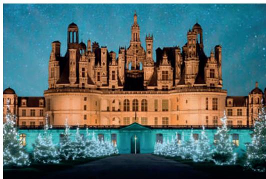
Illuminations de Noël à Chambord