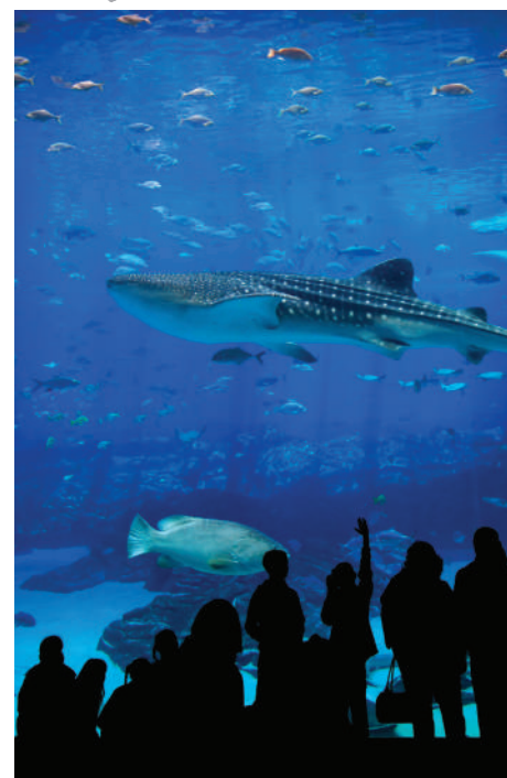
Le Grand Aquarium de Lyon

Sur tous nos séjours : activités de loisirs, veillées, soirées à thèmes organisées par notre équipe d'animation sur place.