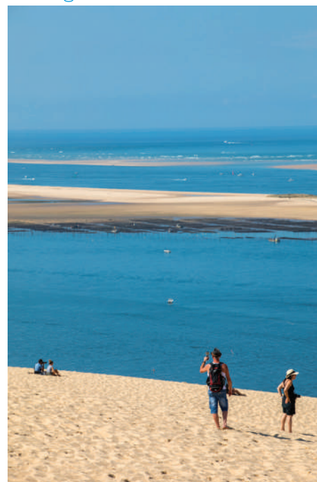
La Dune du Pilat