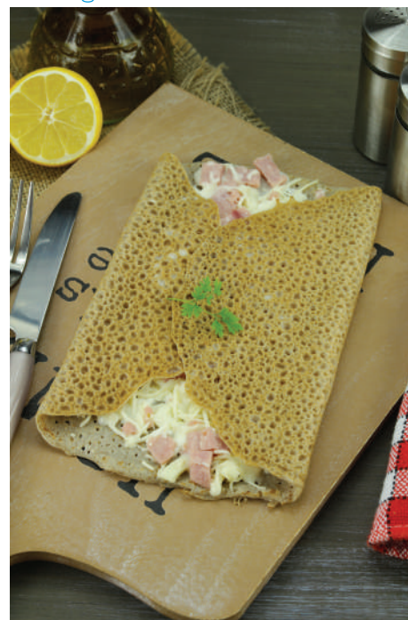
Dégustation de crêpes bretonnes