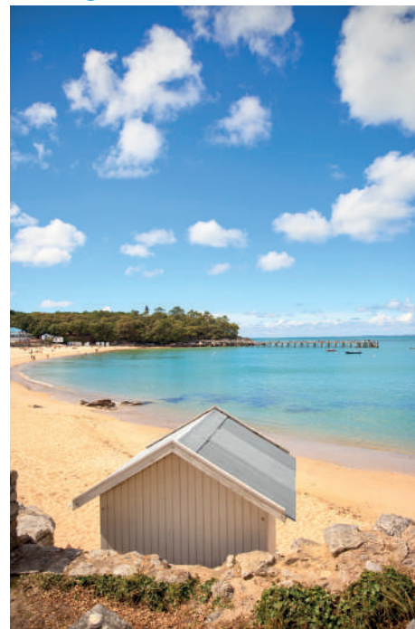
Les stations balnéaires du Sud Vendée