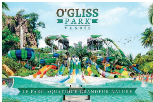
O'Gliss Park - Parc aquatique

Sur tous nos séjours : activités de loisirs, veillées, soirées à thèmes organisées par notre équipe d'animation sur place.