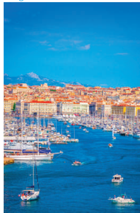
Visite de Marseille

Escale et Réorientation : Macon ou Orange