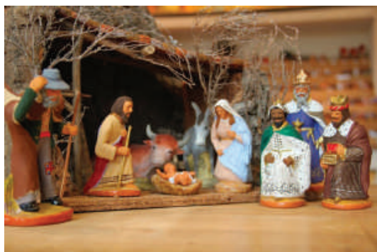
Foire aux sentons de Provence

Sur tous nos séjours : activités de loisirs, veillées, soirées à thèmes organisées par notre équipe d'animation sur place.