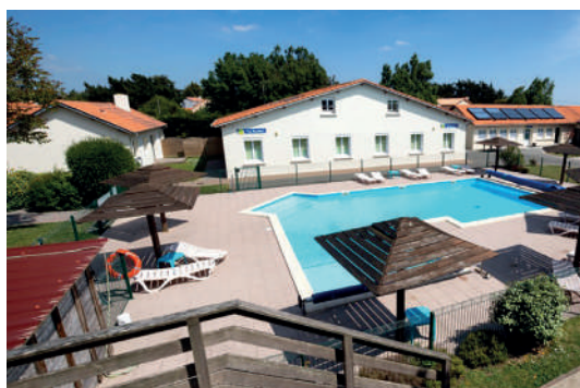
La piscine du village Vacances

Sur tous nos séjours : activités de loisirs, veillées, soirées à thèmes organisées par notre équipe d'animation sur place.