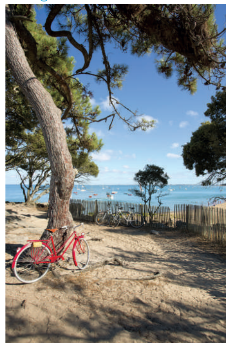
Vélocéan : Balade en vélo au bord de l'eau