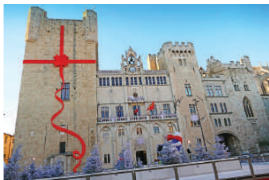
Noël à Narbonne

Sur tous nos séjours : activités de loisirs, veillées, soirées à thèmes organisées par notre équipe d'animation sur place.