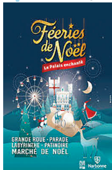
La Grande Parade de Noël

Escale et Réorientation : Macon et Orange