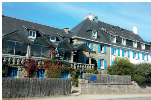
Votre centre de vacances à 150 m de la plage

Sur tous nos séjours : activités de loisirs, veillées, soirées à thèmes organisées par notre équipe d'animation sur place.