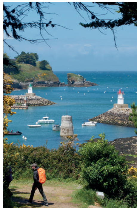
Excursion et visite de Belle-Île-en-Mer