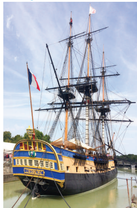
Visite de la frégate corsaire