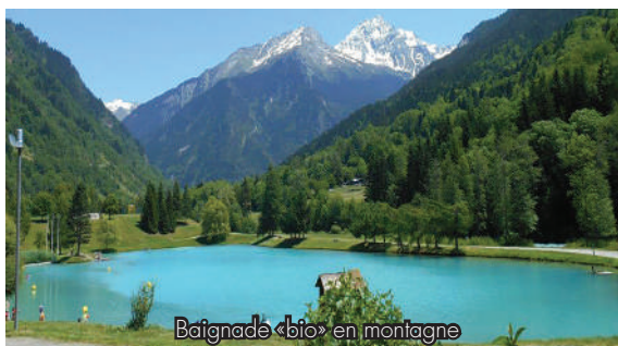
Baignade «bio» en montagne