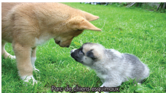
Parc de chiens esquimaux

Sur tous nos séjours : activités de loisirs, veillées, soirées à thèmes organisées par notre équipe d'animation sur place.