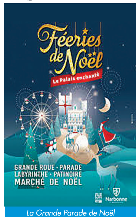
La Grande Parade de Noël

Dates de séjour 23/12/2022 au 02/01/2023