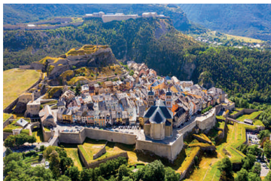
Briançon: Patrimoine mondial de l'UNESCO

Sur tous nos séjours : activités de loisirs, veillées, soirées à thèmes organisées par notre équipe d'animation sur place.