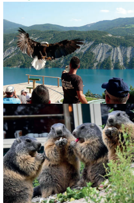
Parc animalier de Serre Ponçon