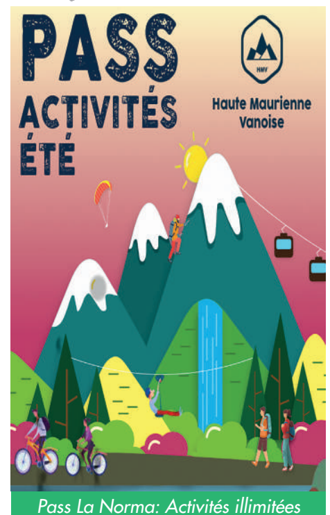
Pass La Norma: Activités illimitées

Dates de séjour 29/07/2023 au 19/08/2023