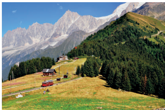
Le Tramway du Mont-Blanc

Sur tous nos séjours : activités de loisirs, veillées, soirées à thèmes organisées par notre équipe d'animation sur place.