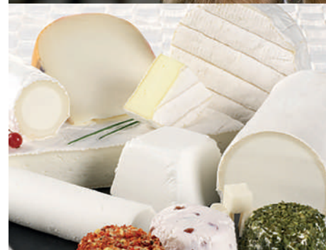
La chèvrerie et dégustation de fromage

Sur tous nos séjours : activités de loisirs, veillées, soirées à thèmes organisées par notre équipe d'animation sur place.