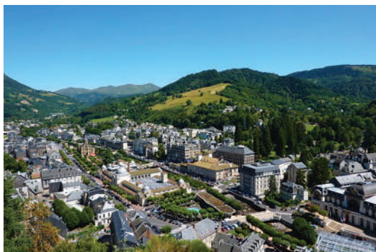
Respirez à La Bourboule

Sur tous nos séjours : activités de loisirs, veillées, soirées à thèmes organisées par notre équipe d'animation sur place.