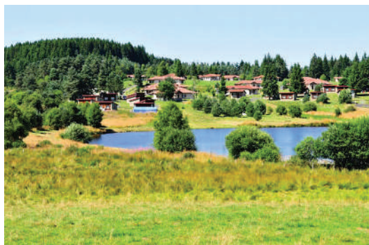
Votre village vacances ***

Sur tous nos séjours : activités de loisirs, veillées, soirées à thèmes organisées par notre équipe d'animation sur place.