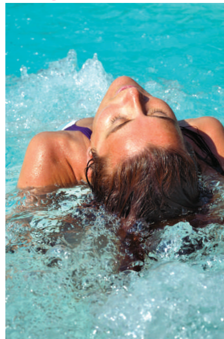
Espace détente sur place