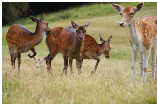
Parc de daims en semi liberté

Sur tous nos séjours : activités de loisirs, veillées, soirées à thèmes organisées par notre équipe d'animation sur place.