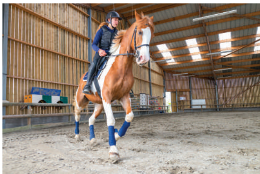
Séances d'équitation encadrées

Sur tous nos séjours : activités de loisirs, veillées, soirées à thèmes organisées par notre équipe d'animation sur place.