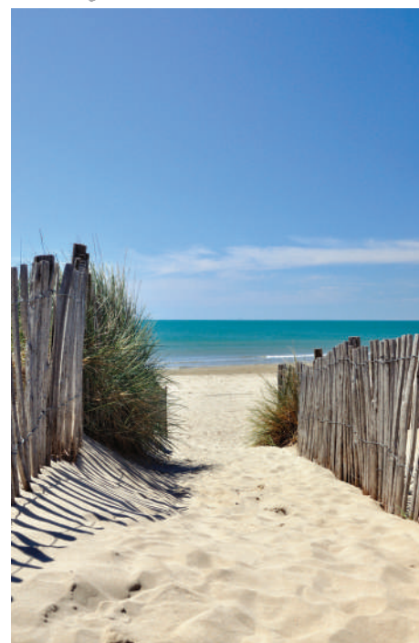
Sortie à la plage

Dates de séjour 29/07/2023 au 12/08/2023