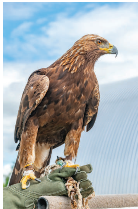
Les Géants du Ciel : Spectacle de rapaces