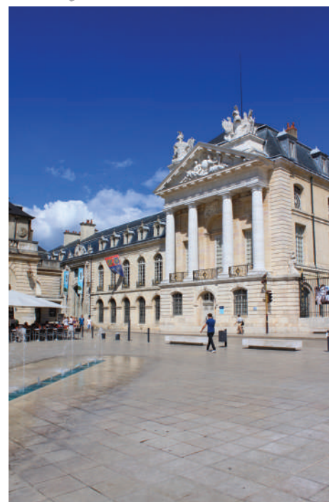
Visites et découverte de Dijon

Dates de séjour 29/07/2023 au 12/08/2023