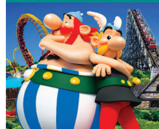
1 journée au Parc Astérix