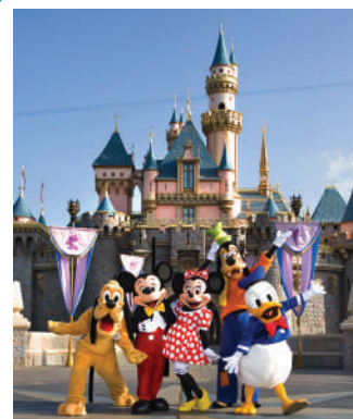
1 journée à Disneyland

Escale et Réorientation : Macon ou Orléans