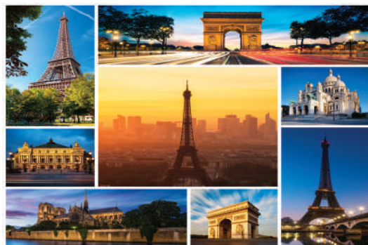
Visites et découvertes de la Capitale

Sur tous nos séjours : activités de loisirs, veillées, soirées à thèmes organisées par notre équipe d'animation sur place.