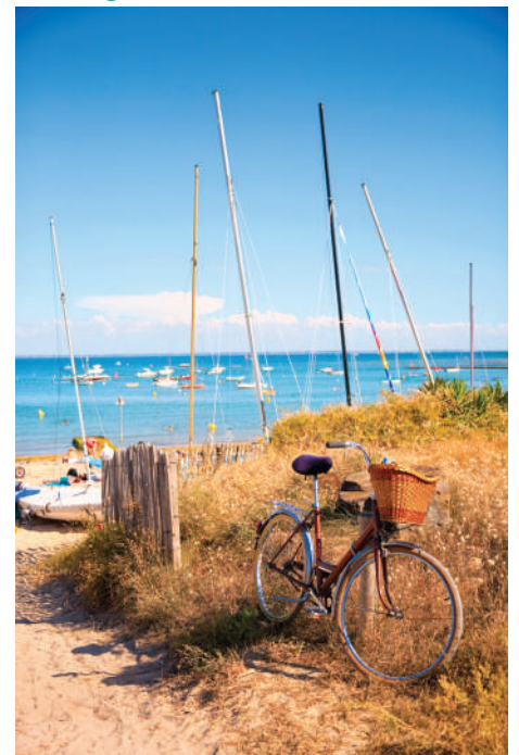
Sortie et activités à la plage