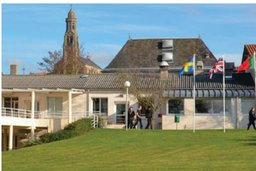
Votre centre de vacances

Sur tous nos séjours : activités de loisirs, veillées, soirées à thèmes organisées par notre équipe d'animation sur place.