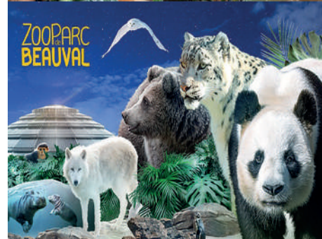
Le Zoo Parc de Beauval