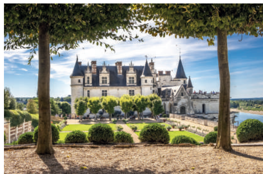
Les Châteaux de la Loire

Sur tous nos séjours : activités de loisirs, veillées, soirées à thèmes organisées par notre équipe d'animation sur place.