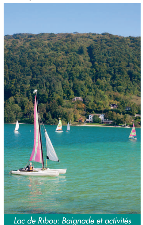
Lac de Ribou: Baignade et activités

Sur tous nos séjours : activités de loisirs, veillées, soirées à thèmes organisées par notre équipe d'animation sur place.