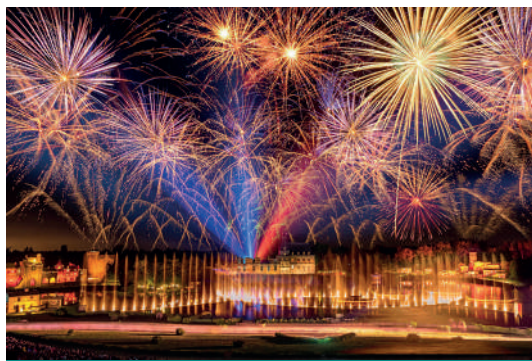
Cinéscénie: Spectacle grandiose