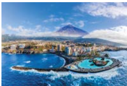
Puerto de la Cruz et le Pic du Teide