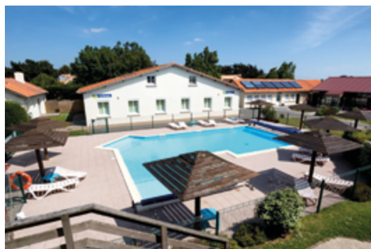
La piscine du village vacances