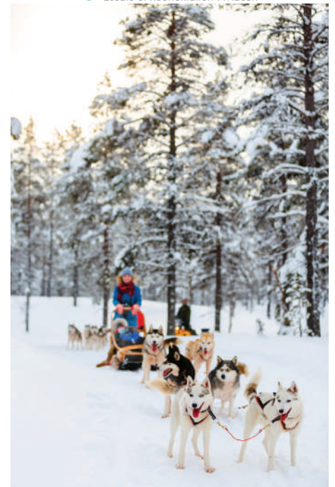
Baptême de chiens de traineaux