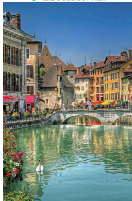
Annecy Le Vieux