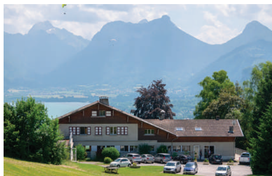
Votre chalet vue Lac

Sur tous nos séjours : activités de loisirs, veillées, soirées à thèmes organisées par notre équipe d'animation sur place.