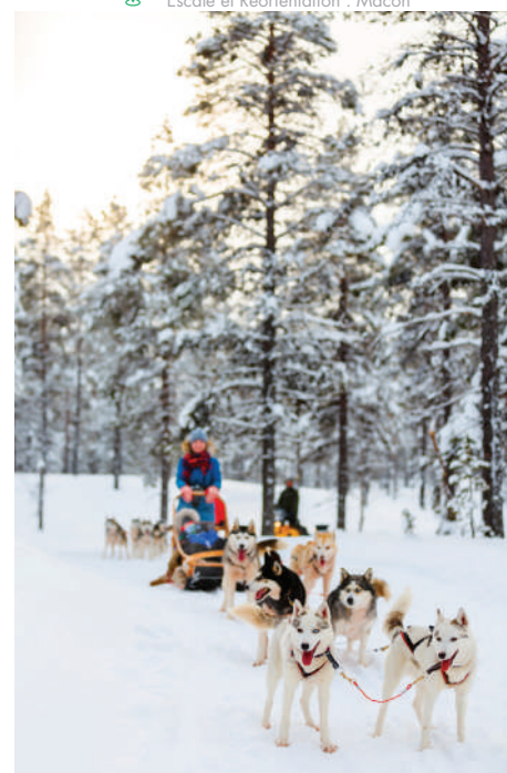
Baptême de chiens de traineaux