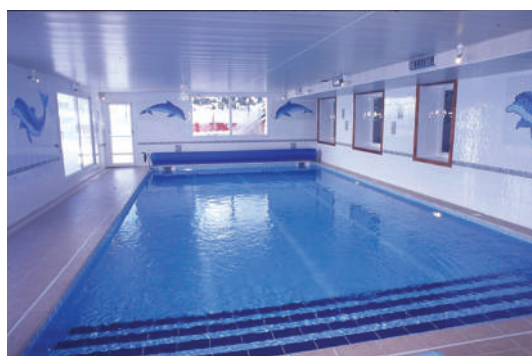
Piscine chauffée sur place

Sur tous nos séjours : activités de loisirs, veillées, soirées à thèmes organisées par notre équipe d'animation sur place.