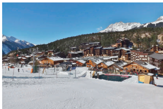
La Norma «Station 100 % piétonne»

Sur tous nos séjours : activités de loisirs, veillées, soirées à thèmes organisées par notre équipe d'animation sur place.