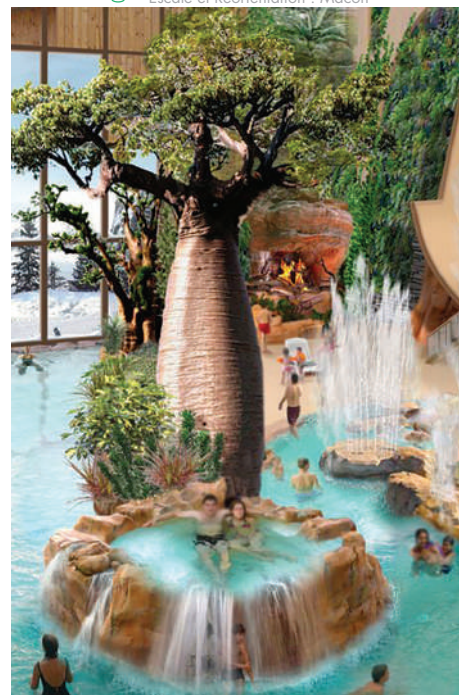
Aquariaz : Les Tropiques à la montagne