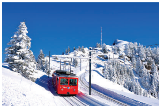
Le Tramway du Mont Blanc

Sur tous nos séjours : activités de loisirs, veillées, soirées à thèmes organisées par notre équipe d'animation sur place.