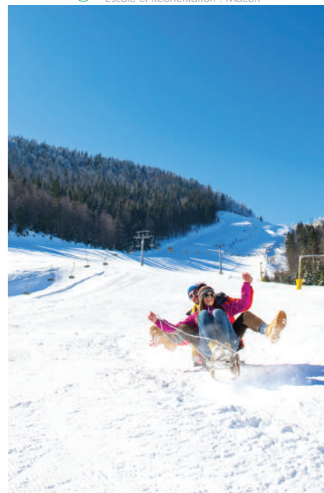
On s'éclate à la montagne !