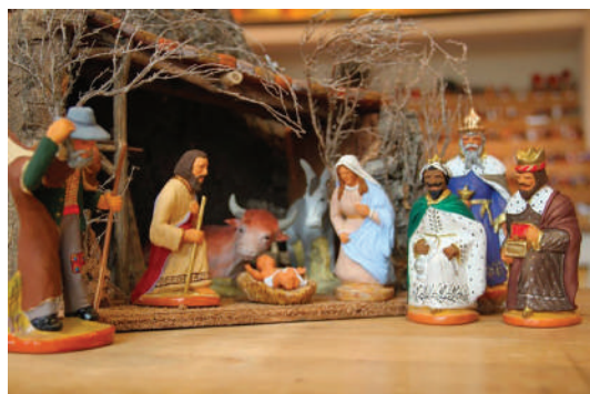
Foire aux Santons de Provence

Sur tous nos séjours : activités de loisirs, veillées, soirées à thèmes organisées par notre équipe d'animation sur place.