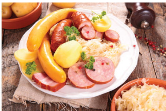
Dégustation de la Choucroute Alsacienne

Sur tous nos séjours : activités de loisirs, veillées, soirées à thèmes organisées par notre équipe d'animation sur place.