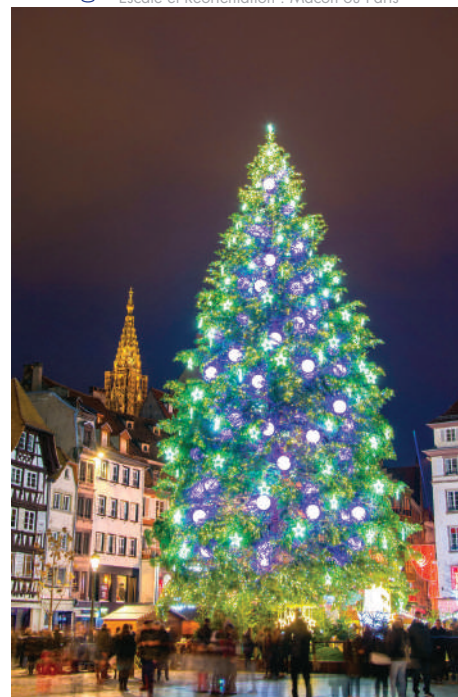
Marché de Noël de Strasbourg

Escale et Réorientation : Macon ou Paris