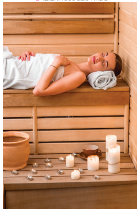
Espace détente de la station