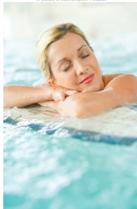
Les Thermes de Saint Gervais