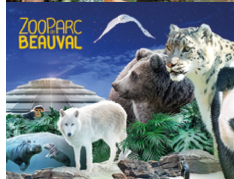
Le Zoo Parc de Beauval

Dates de séjour 03/08/2024 au 17/08/2024