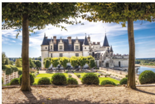
Les Châteaux de la Loire

Sur tous nos séjours : activités de loisirs, veillées, soirées à thèmes organisées par notre équipe d'animation sur place.